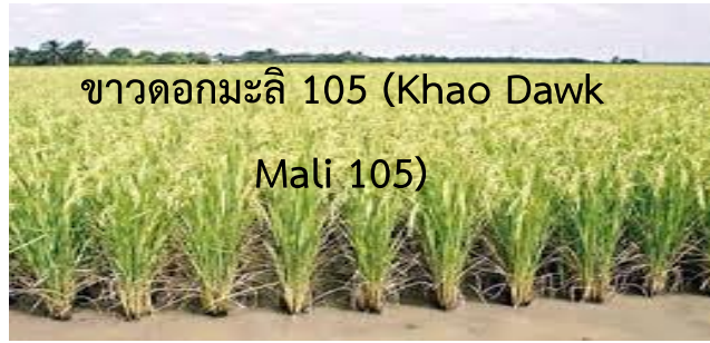
ข้าวดอกมะลิ 105 (Khao Dawk Mali 105)

ชื่อพันธุ์ ข้าวดอกมะลิ 105 (Khao Dawk Mali 105) ชนิด ข้าวเจ้าหอม