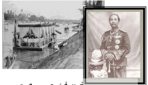
ร.5 เสด็จเมืองอุตรดิตถ์เมื่อวันที่ 23 ตุลาคม 2444

ในปี 2430 พระบาทสมเด็จพระจุลจอมเกล้าเจ้าอยู่หัว (รัชกาลที่ 5) มีพระราชดำริเห็นว่า ตำบลนี้คงจะเจริญต่อไปภายหน้า จึงทรงพระกรุณาโปรดเกล้าฯ ให้ตั้งเป็นเมืองขึ้น เรียกว่า เมืองอุตรดิตถ์ (หมายความถึงเมืองท่าทางเหนือ) แต่ยังคงโปรดให้เป็นเมืองขึ้นกับเมืองพิษณุ ต่อมาในปี 2442 ให้ย้ายศาลากลางจากเมืองพิษณุไปตั้งที่เมืองอุตรดิตถ์