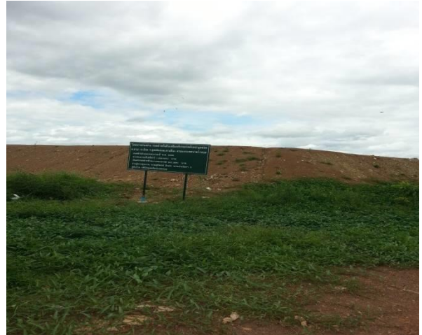
ภาพที่ 2 พื้นที่บ่อฝังกลบขยะของเทศบาลเมืองอุตรดิตถ์

ระบบบำบัดน้ำเสีย จังหวัดอุตรดิตถ์มีระบบบำบัดน้ำเสียชุมชน จำนวน 2 จุด โดยใช้ระบบบำบัดน้ำเสียตะกอนเร่งชนิดถังสำเร็จรูป จุดที่ 1 ในบริเวณสวนสาธารณะริมแม่น้ำน่านหลังลานพระบรมรูปรัชกาลที่ 5 ตำบลท่าอิฐ อำเภอเมือง จังหวัดอุตรดิตถ์ และจุดที่ 2 ในบริเวณสวนสาธารณะเกษมราษฎร์ ตำบลท่าอิฐ อำเภอเมือง จังหวัดอุตรดิตถ์ เป็นระบบถังบำบัดแบบเกรอะ-กรองเติมอากาศ (Septic and Aeration Filter) เป็นถังบำบัดน้ำเสียสำเร็จรูปขนาด 80 ลบ.ม. ต่อวัน ถึงบำบัดน้ำเสียออกแบบให้ฝังอยู่ใต้ดินจุดละ 2 ถัง สามารถรองรับน้ำเสียเต็มศักยภาพของระบบได้ 160 ลบ.ม./วัน/จุด รวมทั้งสิ้นประมาณ 320 ลบ.ม.ต่อวัน ซึ่งปัจจุบันไม่สามารถใช้งานระบบบำบัดน้ำเสียทั้ง 2 จุด ได้เนื่องจากประสบปัญหาอุทกภัยในปี 2553 และเทศบาลเมืองอุตรดิตถ์อยู่ระหว่างจัดทำงบประมาณในการซ่อมบำรุงระบบบำบัดน้ำเสีย โดยประมาณการค่าซ่อมแซมระบบรวบรวมเป็นค่าดำเนินการทั้งสิ้นประมาณ 1,500,000 บาท